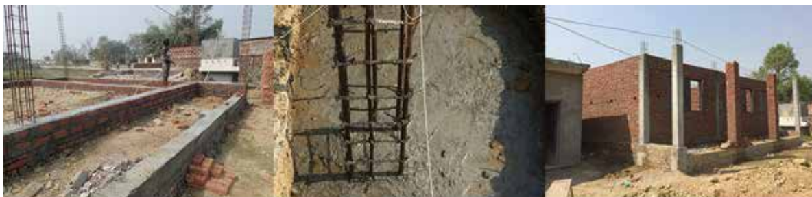
新築中の新川MMR 支援の旅訪問時は基礎工事・現在は屋根まで工事が進みました。

1日も早く開校され、マズワニの子供達とネットワークで繋がる日を楽しみにしています。