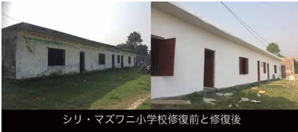
シリ・マズワニ小学校修復前と修復後

老朽化してきた校舎の修復の為に特別募金をお願いしてまいりました。新校舎の建設には相当の金額が必要となりますので、危険のない範囲で再使用できる校舎は修復を進めてまいります。今回の募金額は 500,546 円でシリ・マズワニ小学校を修復いたしました。これからも校舎修復を継続して行く予定なので、再度皆様のご支援、ご協力をお願いいたします。