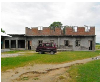
既存の校舎は老朽化が進み、 修復できなまま放置されています。