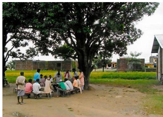
現在のシリ・シッダルト小中校

第二期募集を開始する予定であった平成23年4月1日に先立つ3月11日に発生した東日本大震災により被災した東北地方を支援するため一時的に第二期募集を延期しておりましたが、募集を再開して平成24年中の完成を目標とします。