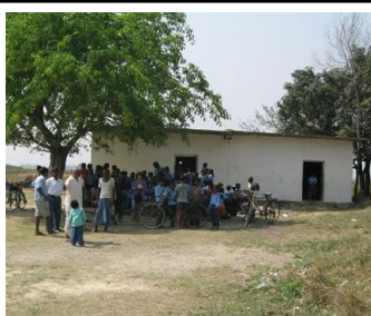
ネパールでは多くの子供が 木の下で授業をしています。

第一期工事完了によって校舎基礎が完成済。 残り3教室を第二期工事によって完成させて